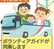
ボランティアガイドが同乗します